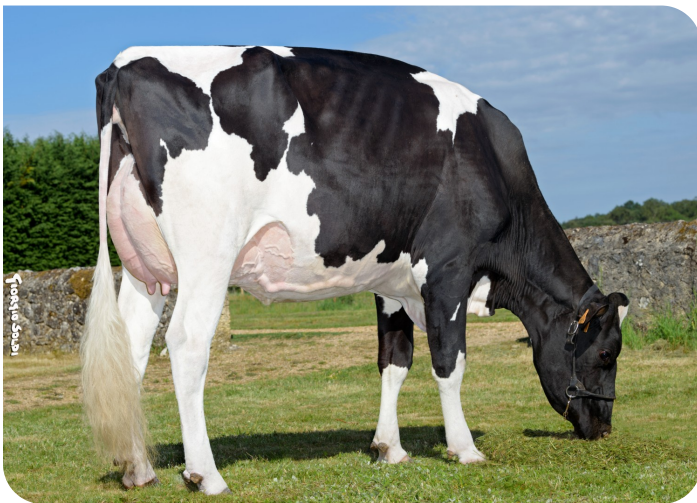
Suzy (p. Adlon P)