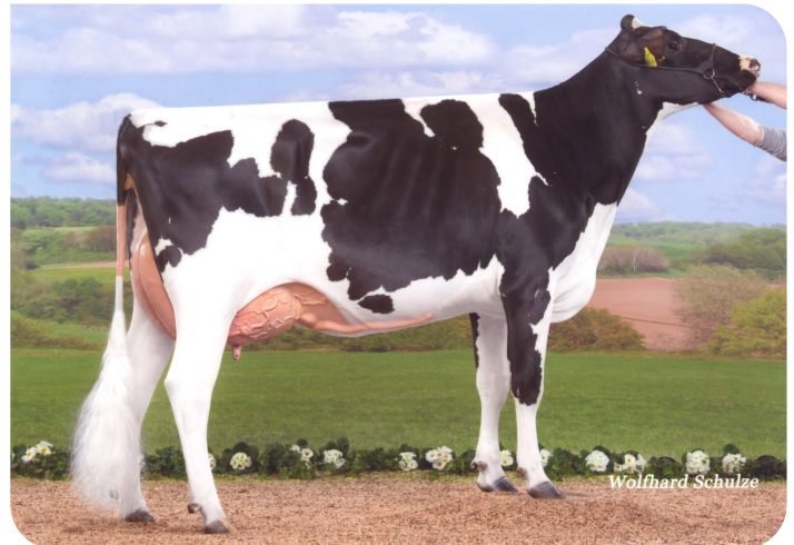
Rica (p. Adlon P)