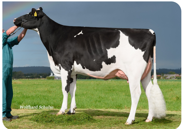
Adia (p. Adlon P)