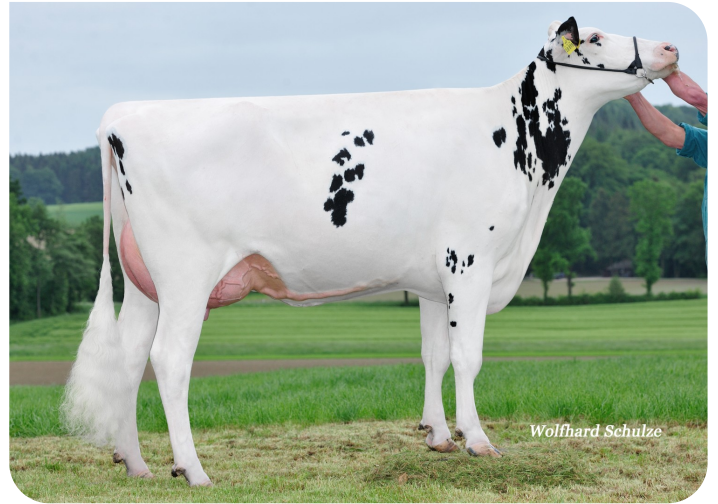
Britney Mère de Adlon P