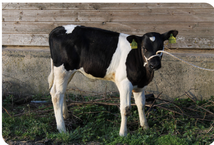
Annelie (p. Anne 6)