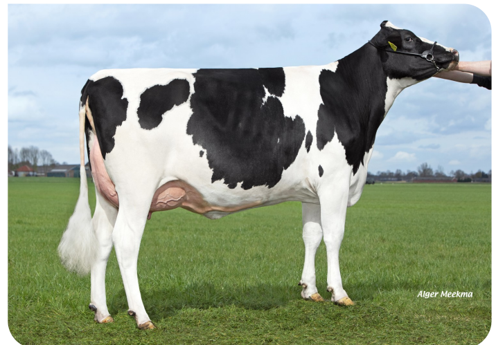
Leida 801 (p. Borg) Prop.: V.O.F. Miskotte, Den Ham (Ov.)(NL)