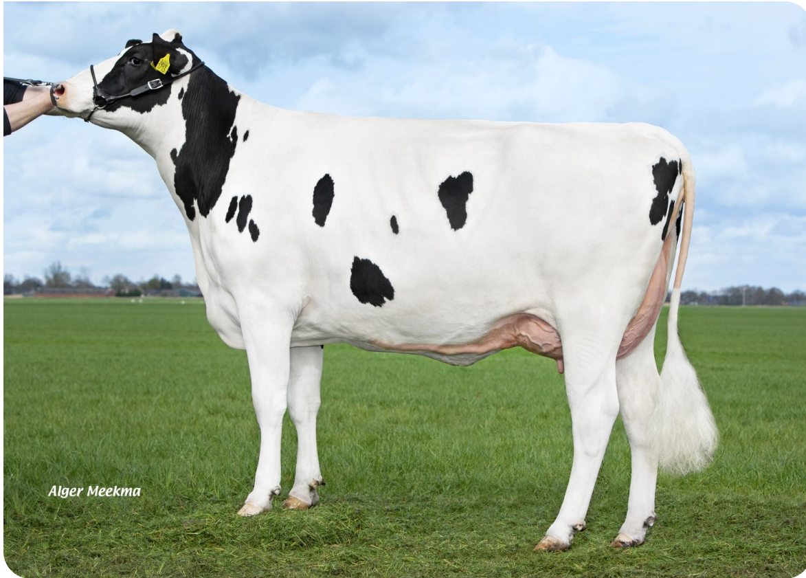
Blanda 16 (p. Borg) Prop.: V.O.F. Miskotte, Den Ham (Ov.)(NL)