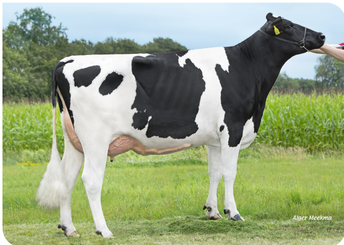
Dora 98 (p. Borg) Prop.: VOF Melkveebedrijf Waterink, Beerzerveld (NL)