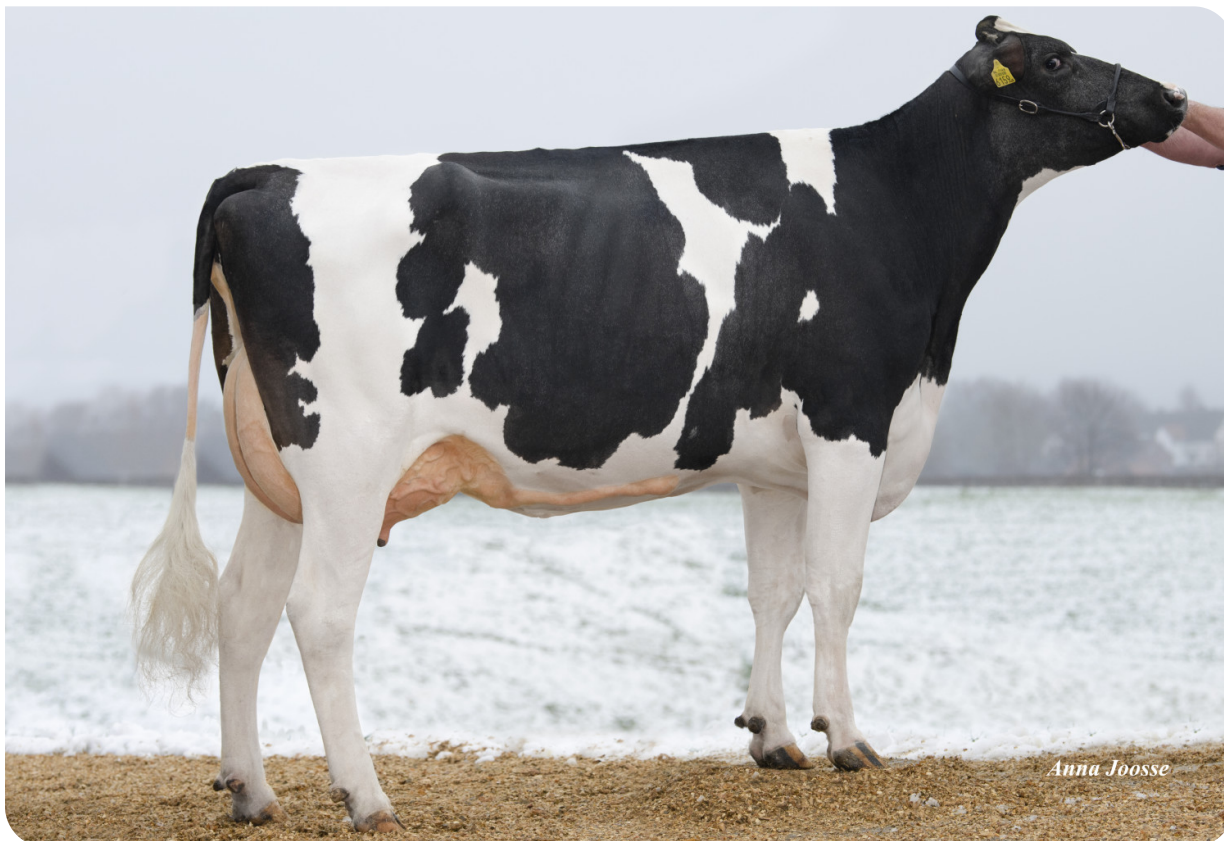
Apina Nadja 143 (AB 88) (mère de Borg)