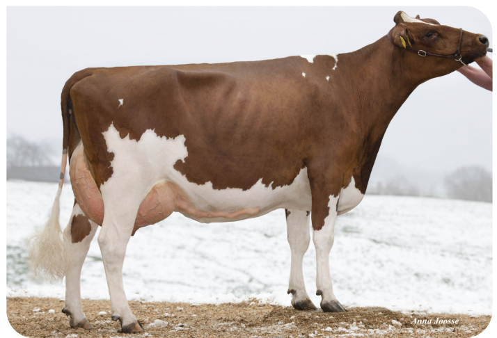
Massia 270 (VG 89) (propre soeur de Movistar)