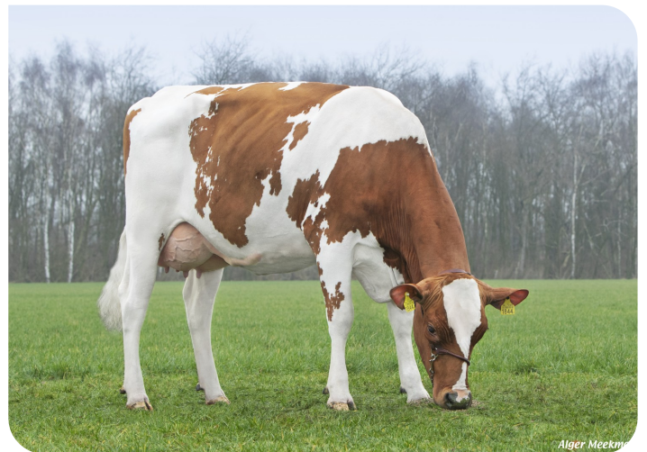
Grashoek Hanna 1844 (p. Movistar)

Prop.: Fok- en melkveebedrijf K.I. Samen B.V., Grashoek (NL)