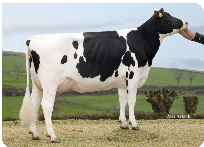
Apina Massia 172 (VG 87) (grand-mère de Movistar)