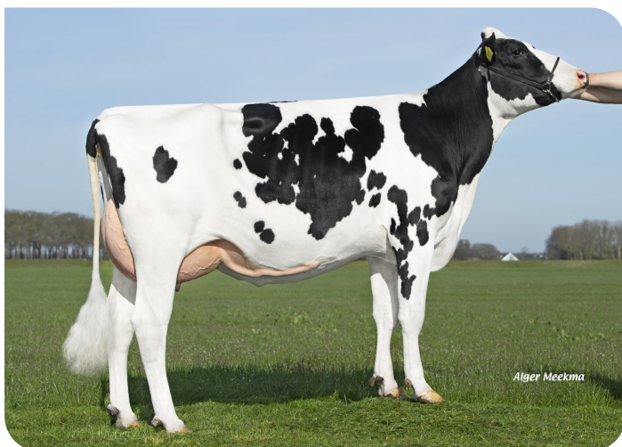
Apina Nadja 167 (p. Movistar) Prop.: Melkveebedrijf Coppelmans VOF, Beerzerveld (NL)