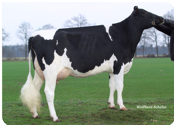
Hf Qualsiasi (VG 87) (grand-mère de Suanley)