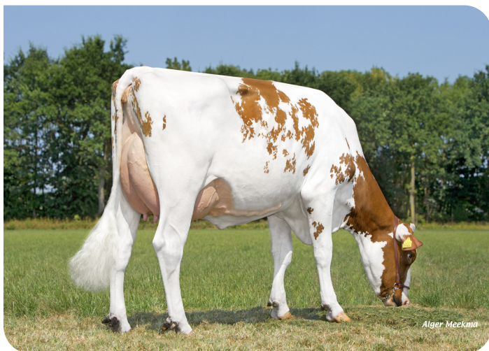
Grashoek Silke 212 (p. Archimedes rf) Prop.: Melkveebedrijf Grashoek b.v., Grashoek (NL)