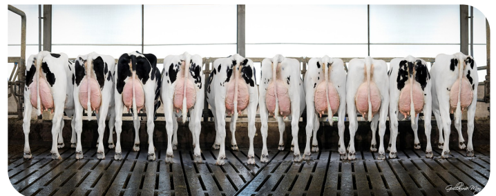
Filles de Mitchell, Molenkamp Holsteins, Maasbommel (NL)