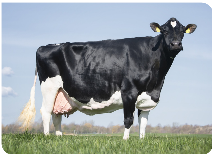
Hanna 912 (EX93) (mère de Ragnar)