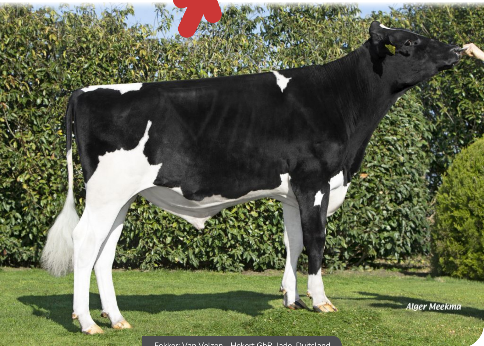
Fokker: Van Velzen - Hekert GbR, Jade, Duitsland