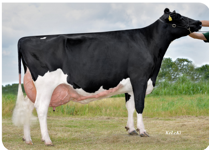
Hanna 912 (EX93) (mère de Ragnar)