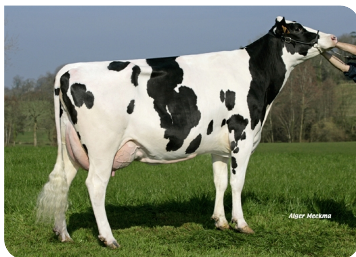
BBH Bebie (plein-soeur de Basman)