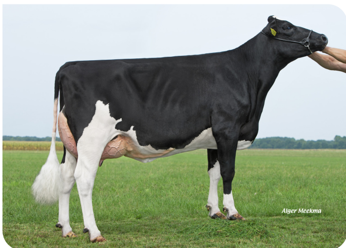
Etta 131 (p. Geronimo)

Prop.: R. & E. v.d. Ven-Scheepens, Vlagtwedde (NL)