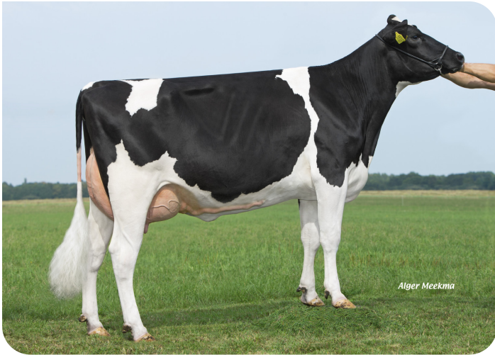
Etta 128 (p. Geronimo) Prop.: R. & E. v.d. Ven-Scheepens, Vlagtwedde (NL)