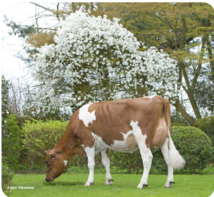
Sonja 98 (p. Geronimo)