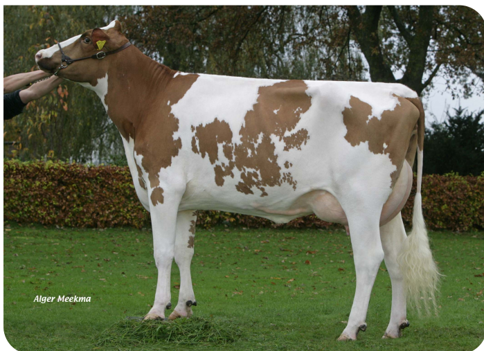
RUW Berta (grand-mère de Beeze Jesley rf (Pp))