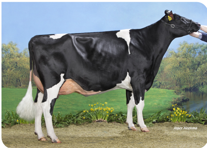
Token 61 (p. Maikman) Prop.: Dhr. G. van Zandwijk, Vuren (NL)