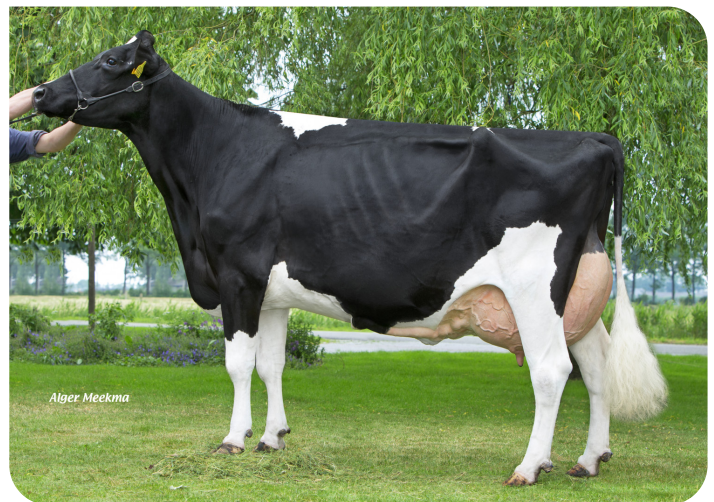
Beeze Roza 48 (EX 90) (mère de Maikman)