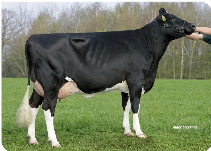
Brechtje 1 (p. Blackjack) Prop.: Mts. de Groot, De Rips (NL)