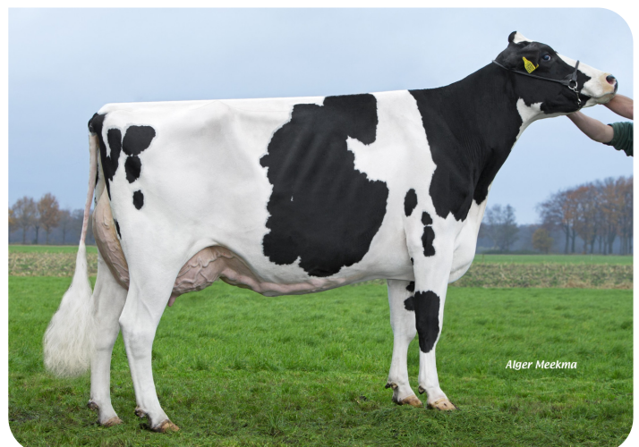
Big Elsie 7 (VG 89) Mère de Macht