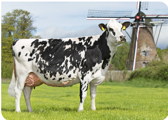
Bots Coba 39 (p. Malki) Prop.: Melkveebedrijf Bots, Rekken (NL)

2.01 338jrs 8081kg 4.82% 3.95% 3.02 456jrs 13116kg 4.63% 4.05% 4.06 398jrs 12652kg 4.42% 4.01% 5.09 331jrs 10459kg 4.77% 4.14% 6.09 264jrs 6284kg 5.41% 4.44% 7.08 349jrs 11478kg 4.59% 3.92% 88 87 88 88 VG 88