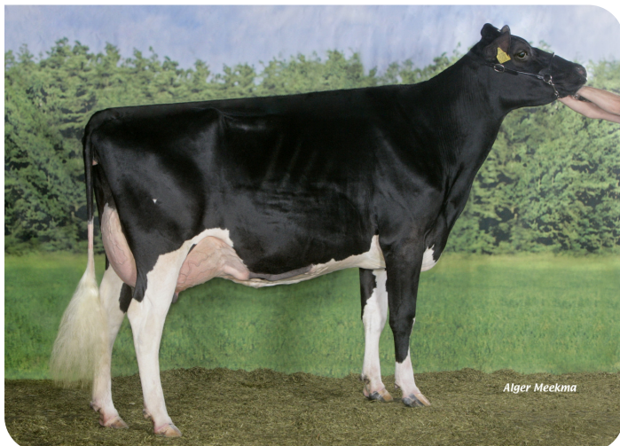
Big Anna Jacoba 115 (EX 90) (mère de Sentaro)