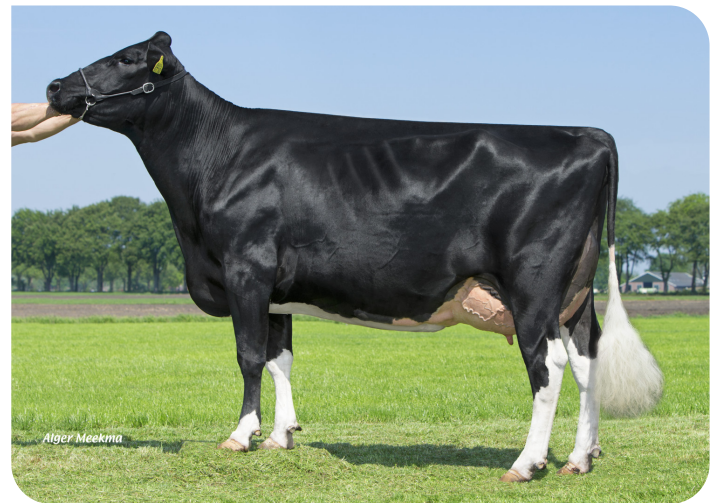
Big Anna Jacoba 126 (VG 87) (p. Shogun PS) (plein-soeur de Sentaro)