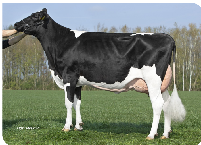
Grashoek Venetie 17 (p. Bisor)

Prop.: Fok- en melkveebedrijf K.I. Samen B.V., Grashoek (NL)