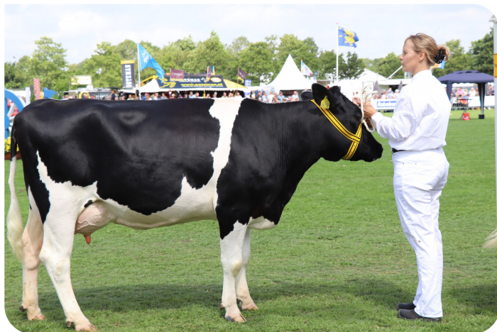
Jet 183 (p. Bas 8)