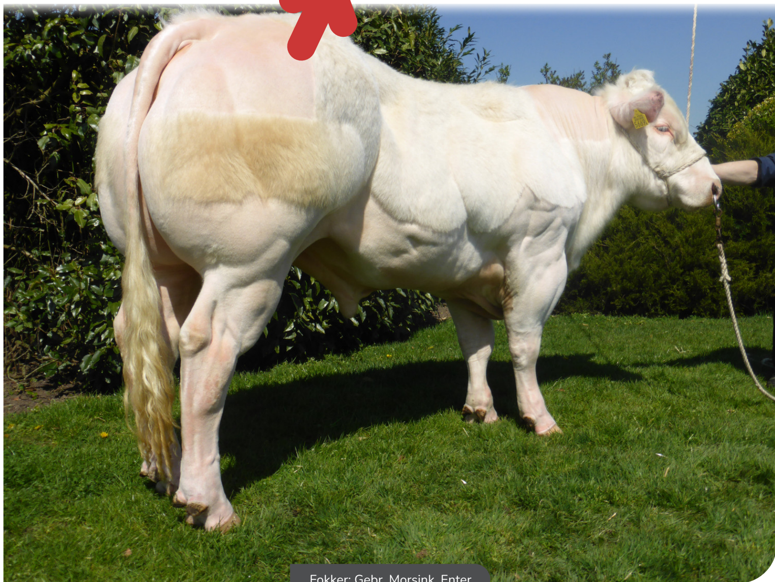
Fokker: Gebr. Morsink, Enter