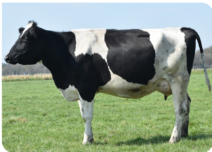
Mosel (p. Bouwe 9) Prop.: Landwirt. Betrieb Gruben, Nortmoor (DE)