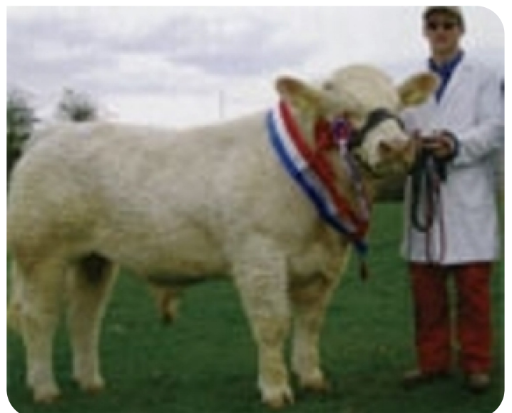
Boulteen Uranium (fils de Orinaloin)