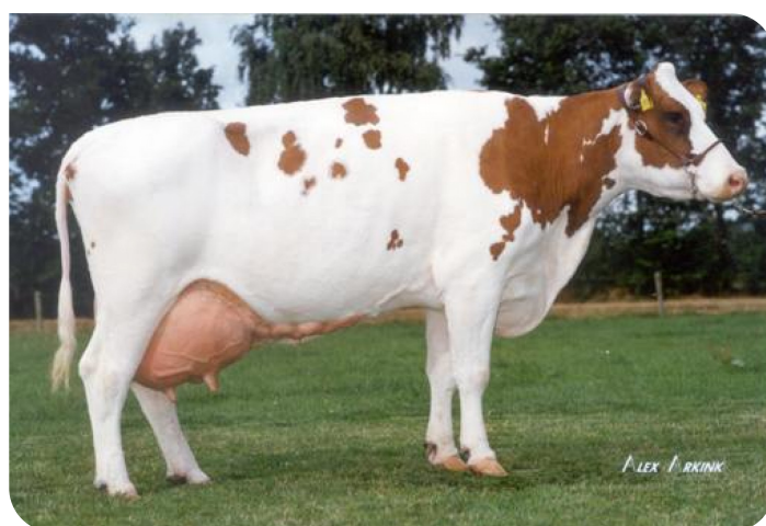
Hilda 98 (VG 89) (mère de Dani)