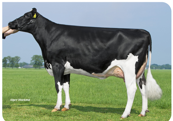
Willsbro Nuggett Aderyn (VG 85) (mère de Davy)