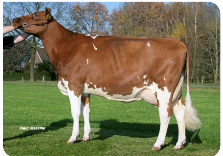
Grashoek Dora 500 (p. Abel) Propriétaire: Melkveebedrijf Engelen v.o.f., Grashoek (NL)