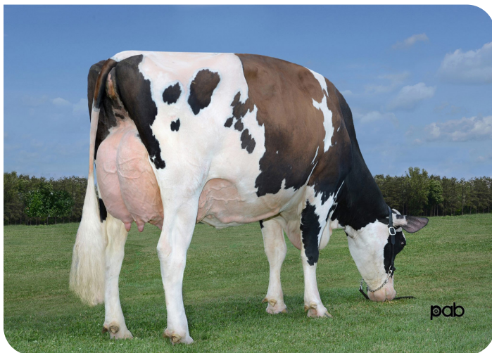
KHW-I Aika Baxter (grand-mère de Alphaman)