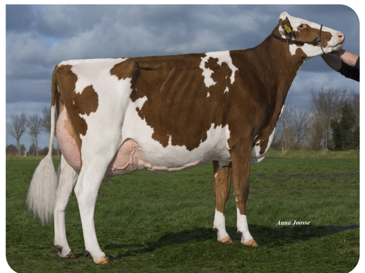
BTS Avea Red (mère de Alphaman)