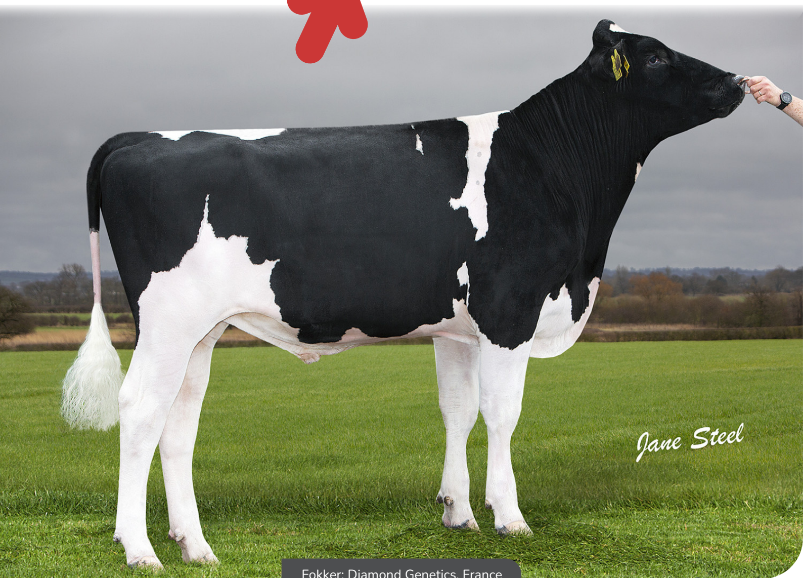
Fokker: Diamond Genetics, France