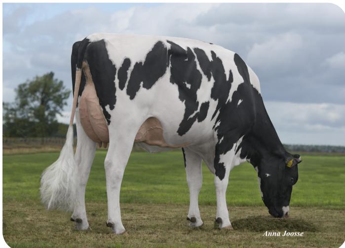
De Volmer DG Caylee (VG 86) (gand-mère de Casimir)