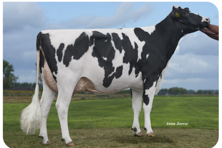
De Volmer DG Caylee (VG 86) (grand-mère de Casimir)