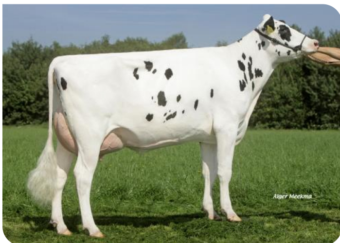
Grashoek Angel 45 (p. Dropshot)

Prop.: Melkveebedrijf Engelen v.o.f., Grashoek (NL)