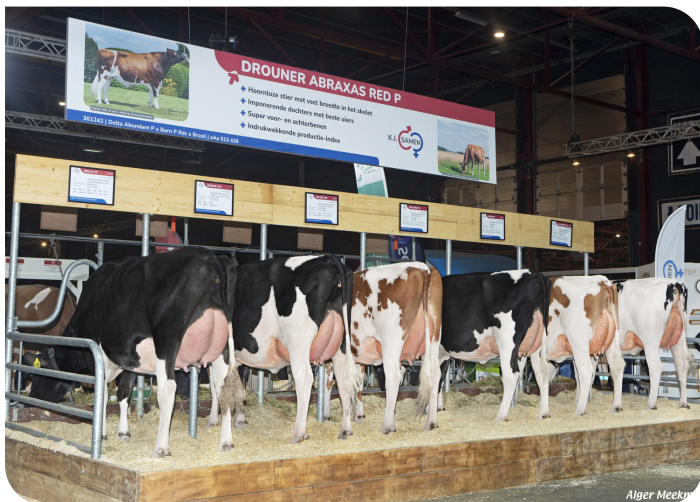
Groupe de filles de Abraxas Red P HHH Leeuwarden 2025