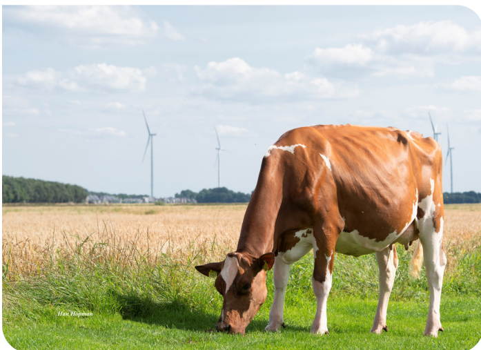
Drouner Aiko 1591 (VG 88) Mère de Abraxas Red P