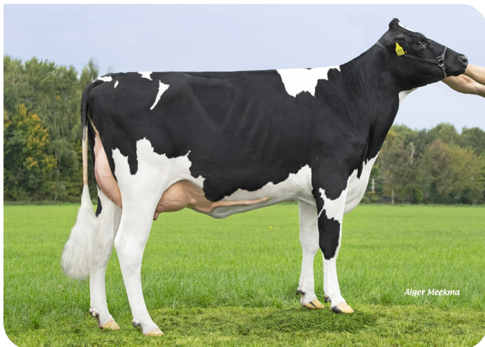
Grashoek Becky 45 (VG 86) (p. Aras) Prop.: Fok- en melkveebedrijf K.I. SAMEN, Grashoek