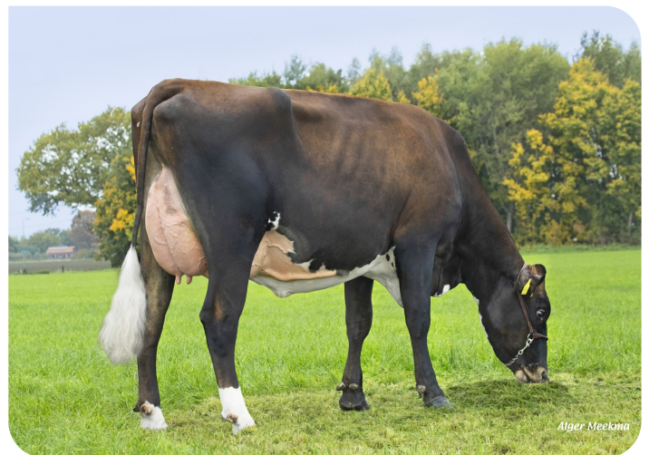
Grashoek Tonnie 108 PP (p. Aras, 75% HF, 25% BS) (VG 85) Prop.: Fok- en melkveebedrijf K.I. SAMEN, Grashoek