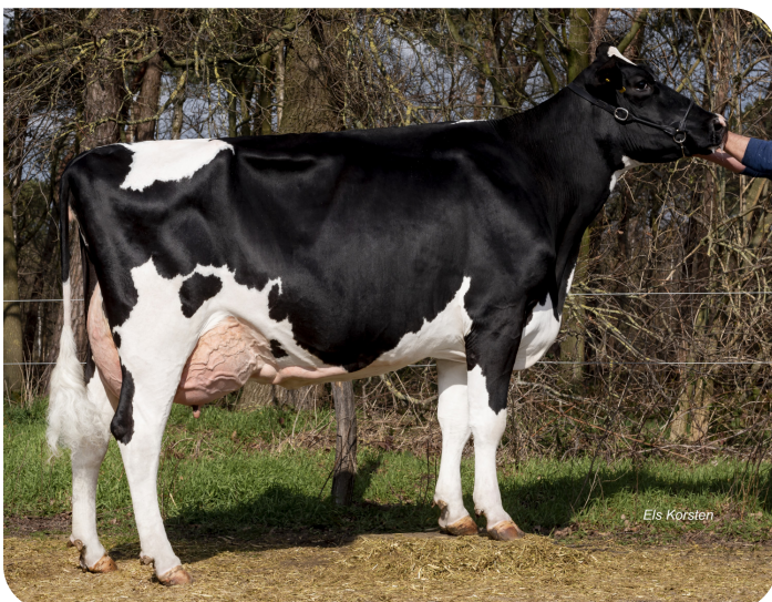
Delta Madame 6 (VG 87) Mère de Magician RF