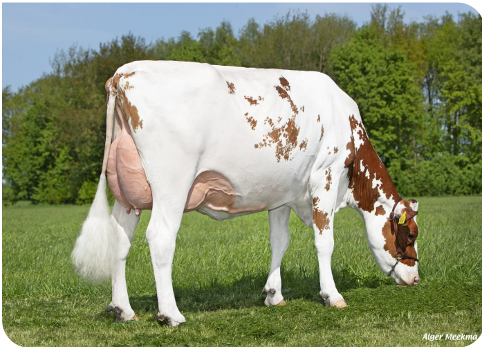
Grashoek Elsje 73 (p. Magician)

Prop.: Fok- en melkveebedrijf K.I. Samen B.V., Grashoek (NL)