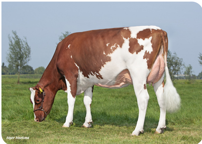
Neeltje 23 (p. Magician RF)