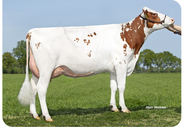
Grashoek Beatrix 177 (p. Magician RF)

Prop.: Verburg-de Groot V.O.F., Reeuwijk (NL)