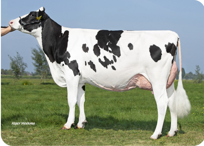
Leentje 3 (p. Magician RF)