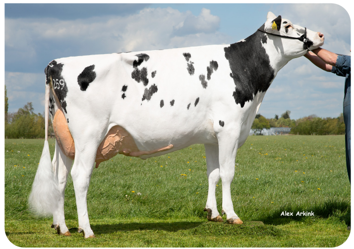
Eastland Rusty 1269 (VG 89) (pleine sœur de la mère de Wishlist)