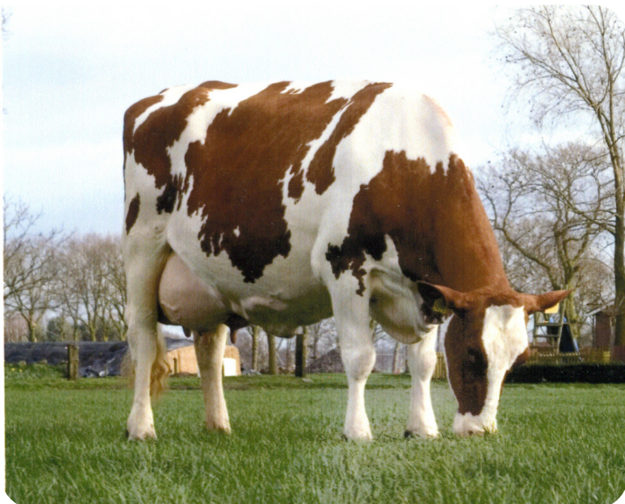
Magy 3 (VG 87) (mère de Elmar)