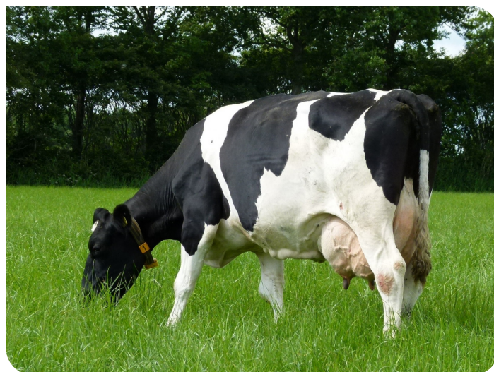
Emma 530 (grandmère d' Eppie 2)