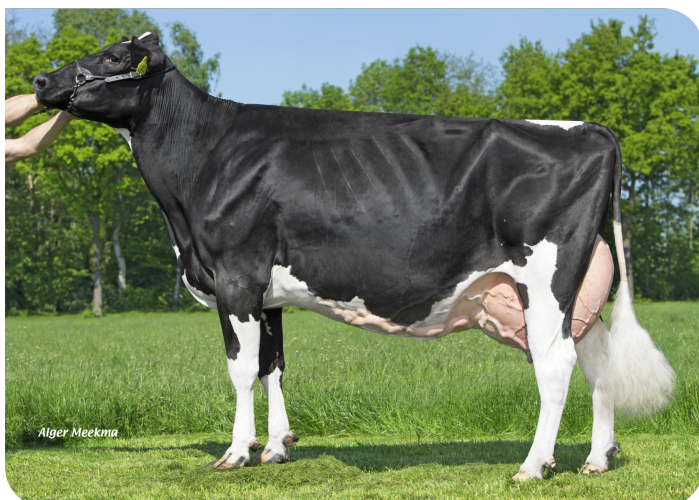
HBC Jerudo Alves AD (plein-soeur de FaWi Pirlo rf) Prop.: Melkveebedrijf Grashoek b.v., Grashoek (NL)