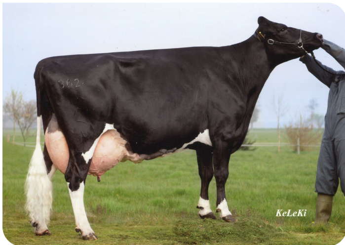
GAH Magic 362 (grand-mère de Hurricane)