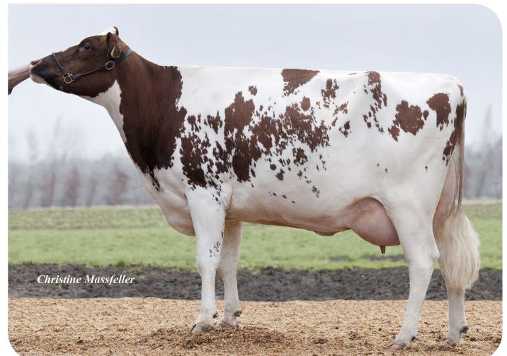
RH Meggy-J (VG 88) (mère de Gandalf)