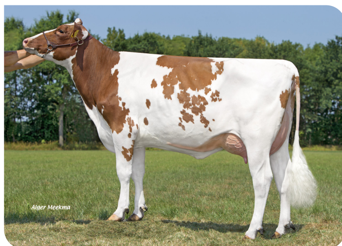
Grashoek Aiko 3 PP (soeur de Kentucky (Pp)) Prop.: Melkveebedrijf Grashoek b.v., Grashoek (NL)