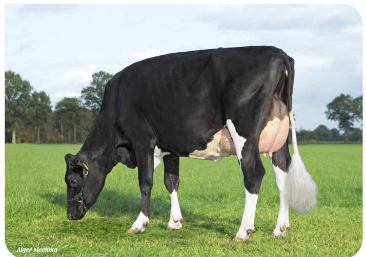
Grashoek Nel 193 (p. Kentucky (Pp)) Prop.: Melkveebedrijf Grashoek, Grashoek (NL)