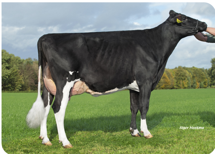
Grashoek Nel 193 (p. Kentucky (Pp)) Prop.: Melkveebedrijf Grashoek, Grashoek (NL)