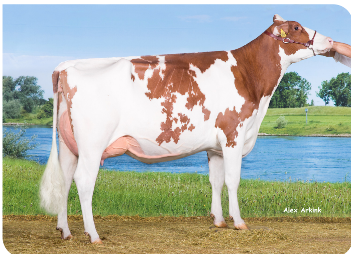
Drouner AJDH Aiko 1288 (VG 88) (demi-soeur de Kentucky (Pp))