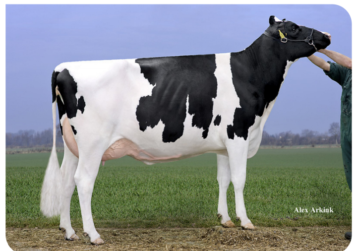
Drouner AJDH Aiko (VG 87) (mère de Kentucky (Pp))