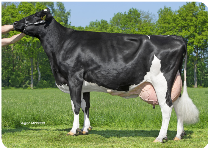
Desibon 32 (VG 87) (mère de Marenò)