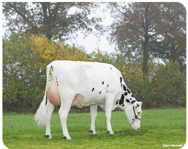
Quarrel 54 (p. Mareno) Prop.: Mts. Steenblik-Tetteroo, Ruurlo (NL)