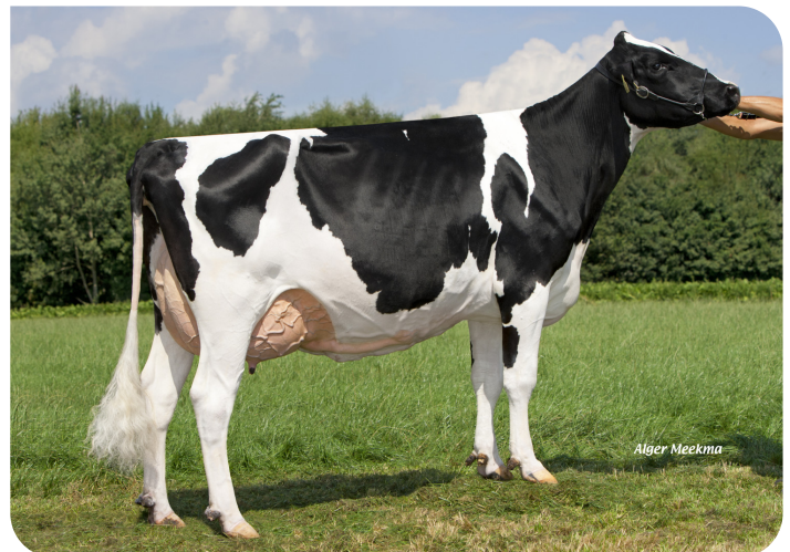
Grashoek Nel 118 (grand-mère de Navajo (Pp))