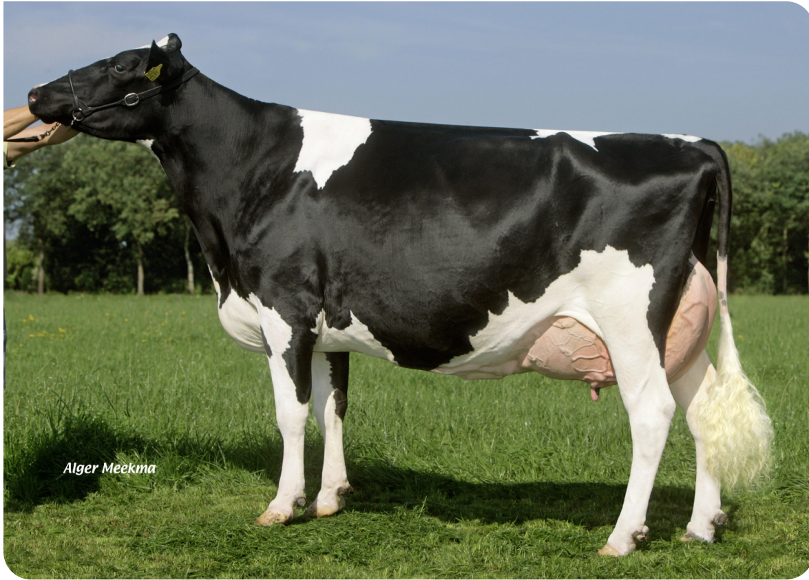
Grashoek Nel 96 (arrière grand-mère de Navajo (Pp))