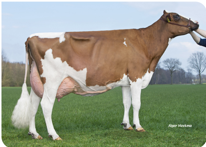
Grashoek Nel 139 (PP) (mère de Navajo (Pp))