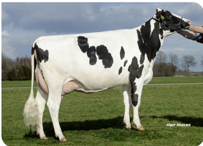
Grashoek Silke 78 (VG 88) (grandmère de Talent rf)