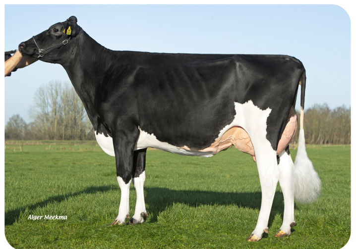
Holbra Malon 16 (VG 87) (mère de Sané)