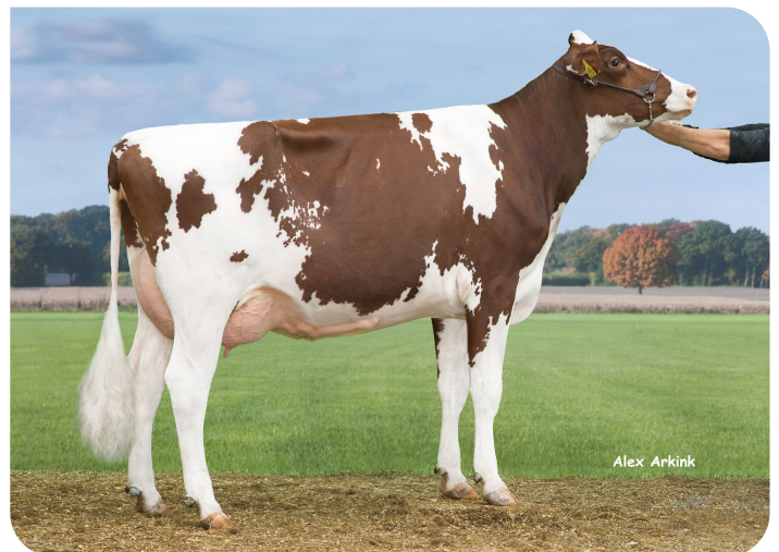
Huntje Holsteins Anemoon 117 (VG 88) (grand-mère de Ravello)