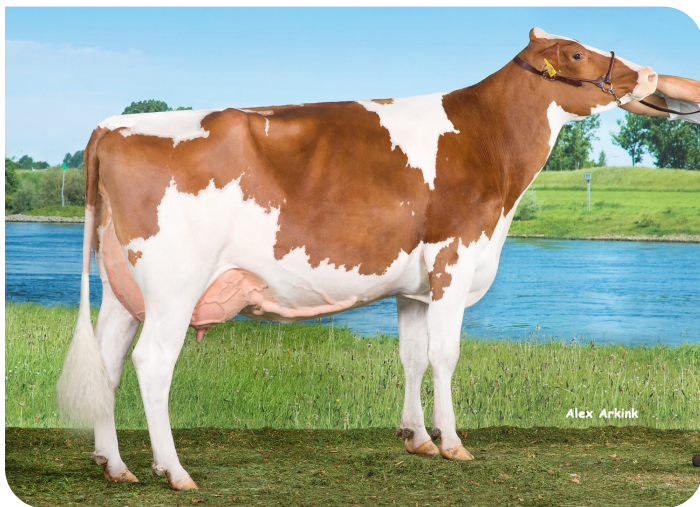
Huntje Holstein Anemoon 183 (mère de Red Ravello)