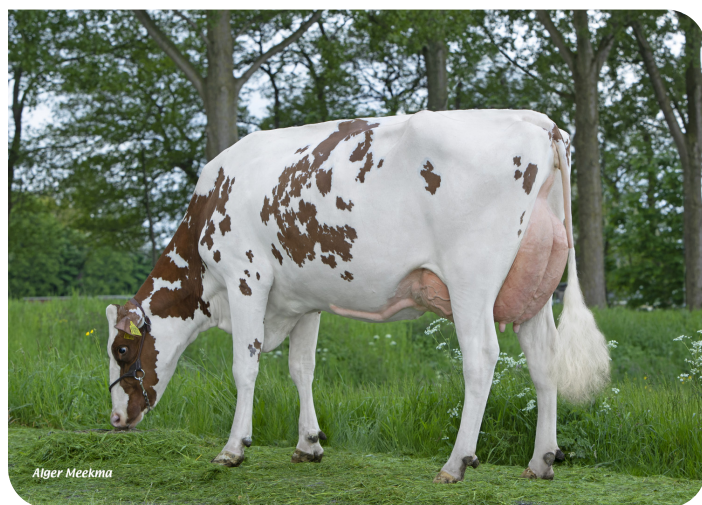
Corrie 90 (p. Red River) (deuxième lactation) Prop.: VOF Verhoef Dairy Farm, Nieuwerbrug aan de Rijn (NL)