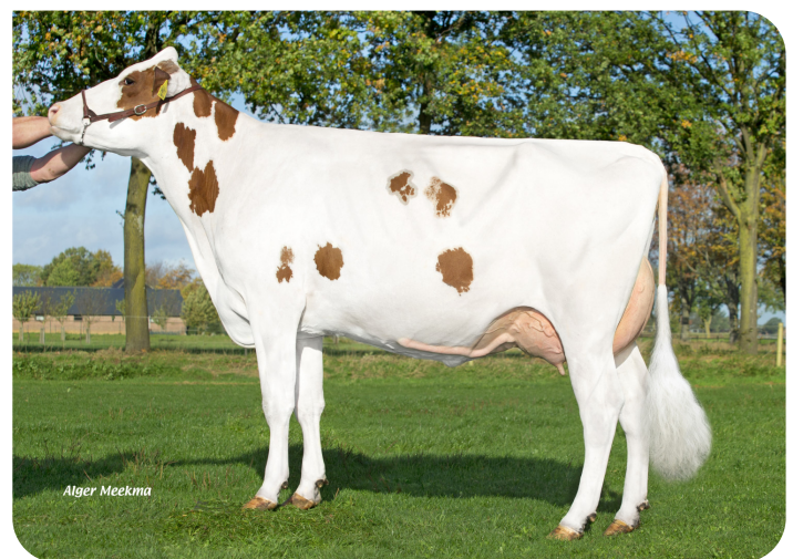
Liza 410 (p. Red River) Prop.: Agri-Services Fokmelkveebedrijf Frencken, Reuver (NL)