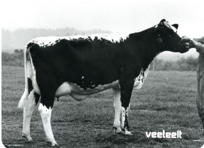
Reigerbek (mère de Ijdel)