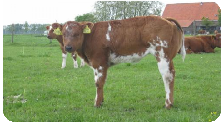
Ingrid 18 (p. Topjob)