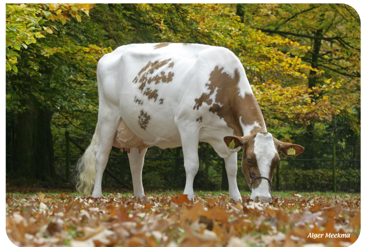
J&G Meisi 5 (VG 89) (mère de Marsman)