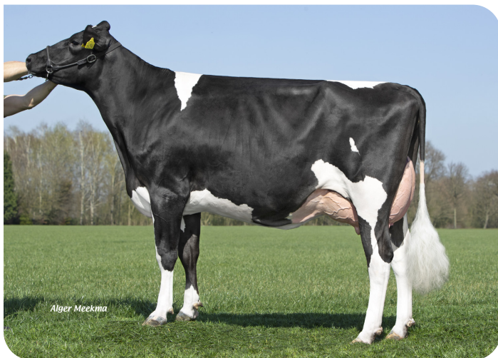
Grashoek Antonia 171 (p. Marsman) Prop.: Melkveebedrijf Grashoek, Grashoek (NL)