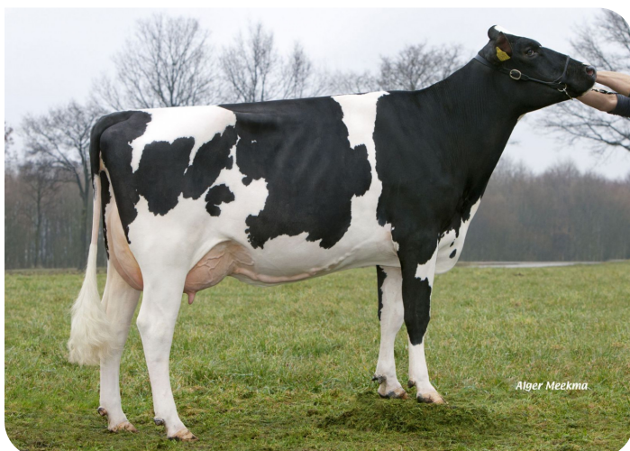
Irma 29 (p. Mr. Justin)

Prop.: V.O.F. Gebleektendijk, Nederweert-Eind (NL)