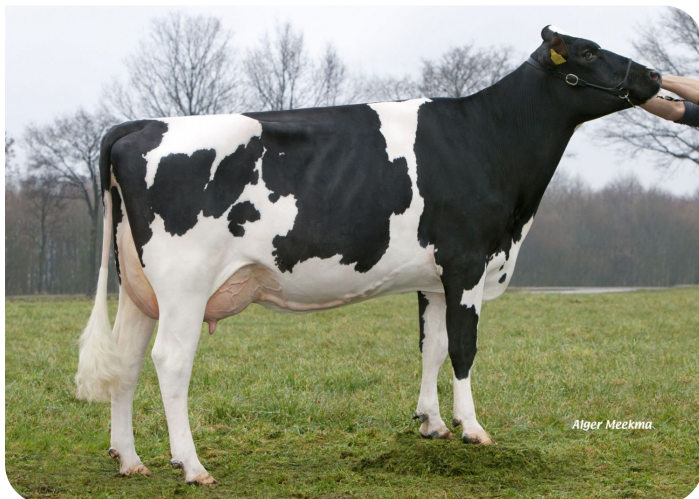
Irma 29 (p. Mr. Justin)

Prop.: V.O.F. Gebleektendijk, Nederweert-Eind (NL)