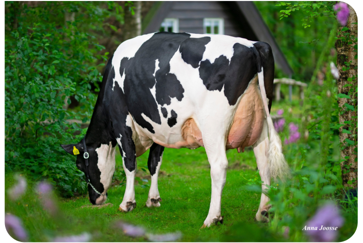
De Oosterhof Dg Rose D (VG89) Grand-mère de Robin Red