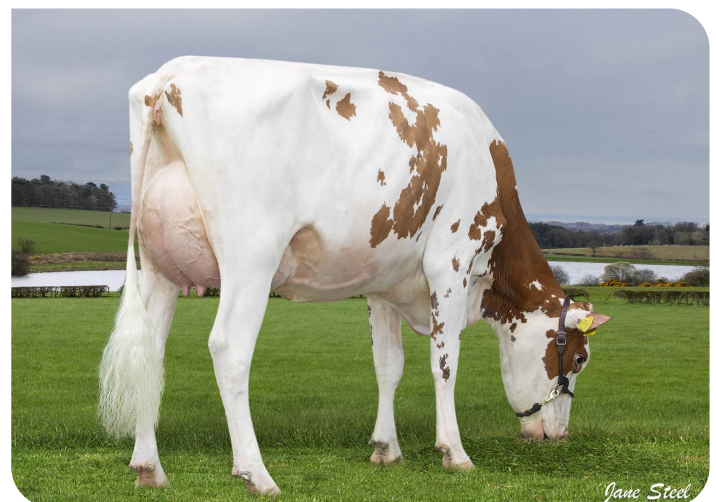
Tarshaw Robin Morag-Red (VG85)(p. Robin Red)