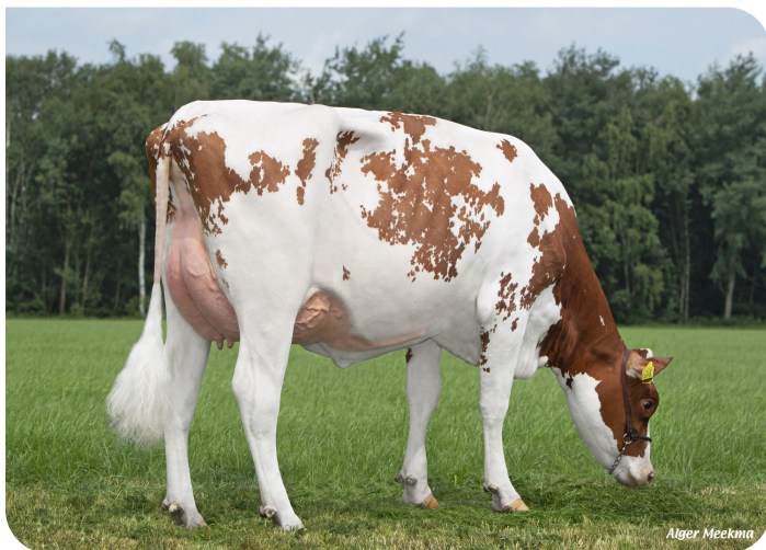
Grashoek Silke 269 (p. Tucson) Prop.: Melkveebedrijf Grashoek b.v., Grashoek (NL)