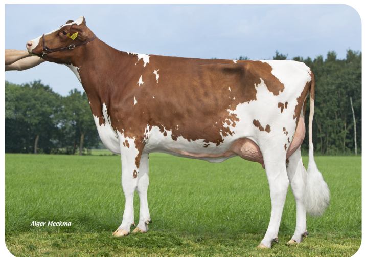
Grashoek Nel 203 (VG 85) (p. Tucson) Prop.: Melkveebedrijf Grashoek b.v., Grashoek (NL)