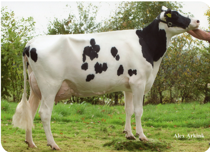
Massia 9397 RF van de Peul (AB 87) (grand-mère de Macgyver)