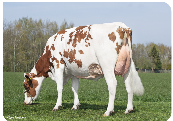
Grashoek Janna 155 (p. Macgyver) Prop: Fok- en melkveebedrijf K.I. Samen B.V., Grashoek (NL)