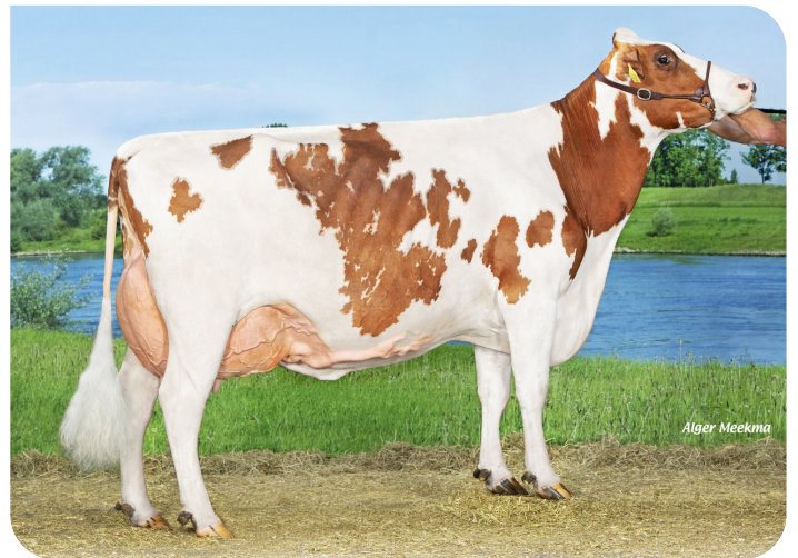
Grashoek Janna 155 (p. Macgyver van de Peul)(4e veau) Prop.: Fok- en melkveebedrijf K.I. Samen B.V., Grashoek (NL)