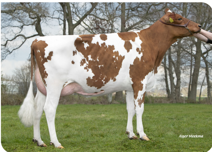
Hanny 71 (p. Macgyver) Prop.: Mts. Overeem, Lunteren (NL)