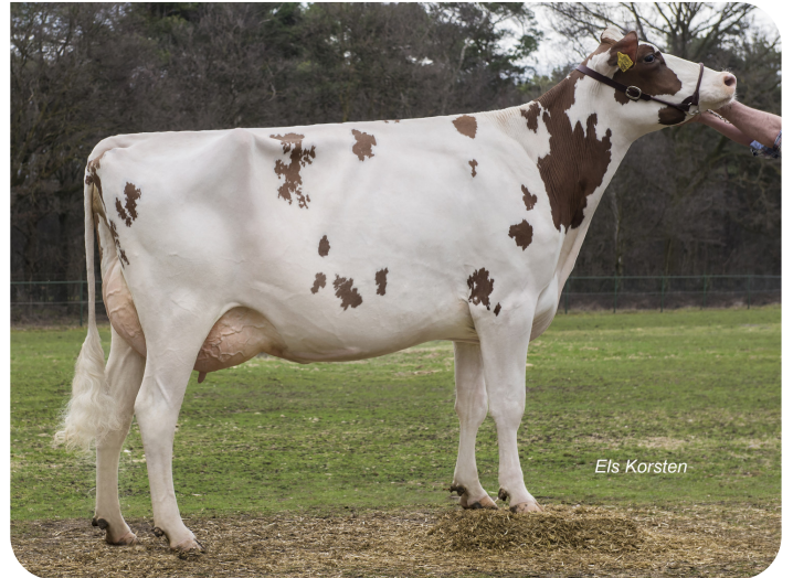
Massia 9857 van de Peul (EX 91) (mère de Macgyver)